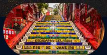
ESCALERAS DE SELARON